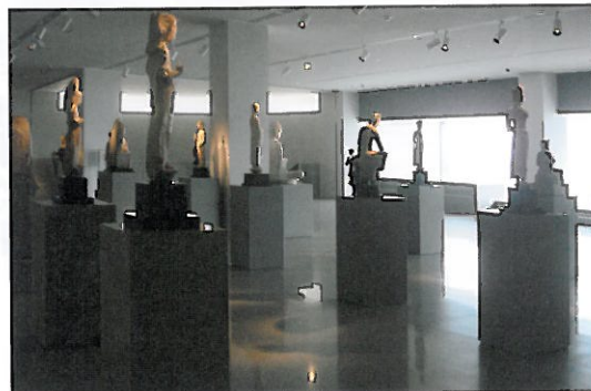
六樓佛教造像展廳