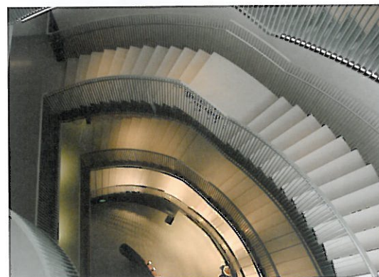
盤旋的鉛灰色樓梯